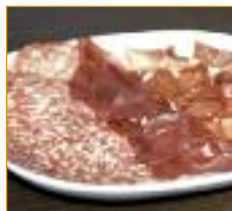
petites charcuteries Vleeswaren