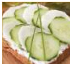
fruits et légumes Groente en fruit